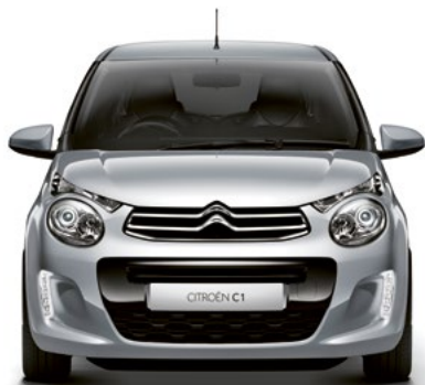
Sivá GALLIUM (M)