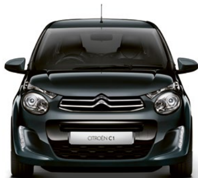
Sivá GALAXITE (M)