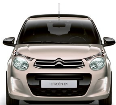
Běžová NUDE (N)