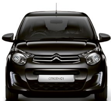
Čierna CALDÉRA (M)