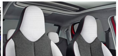
LÁTKA CURIBITA TRITON URBAN RIDE