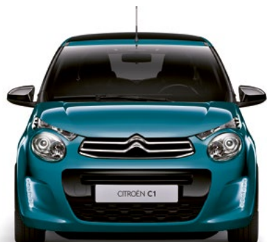
Modrá EMERAUDE (M)

M – metalická farba; N – nemetalická farba