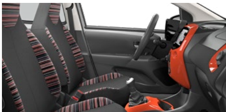
LÁTKA ZEBRA RED