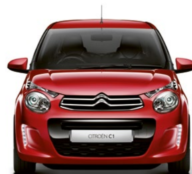
Červená SCARLET (N)