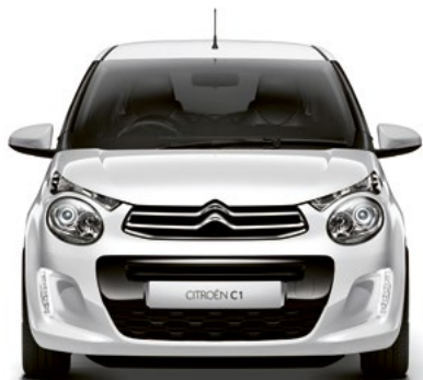
Bielá OURAL (N)