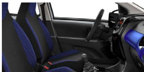
LÁTKA SQUARE BLUE