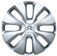
STAR Okrasný kryt 14"