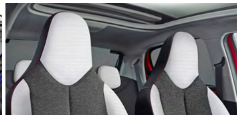
LÁTKA CURIBITA TRITON URBAN RIDE