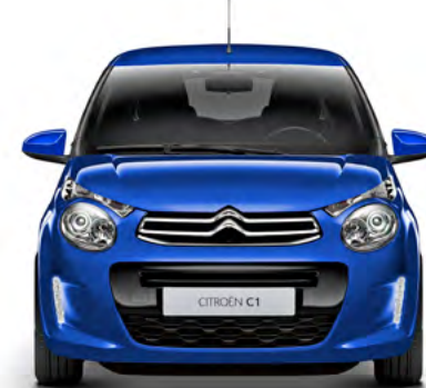
Modrá CALVI (M)