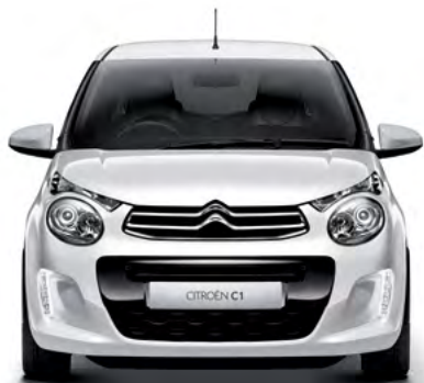
Bielá OURAL (N)