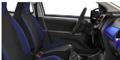
LÁTKA SQUARE BLUE