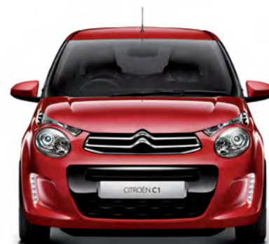
Červená SCARLET (N)