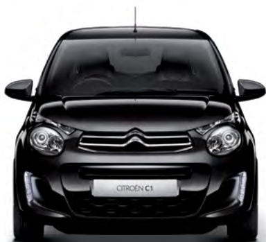
Čierna CALDÉRA (M)