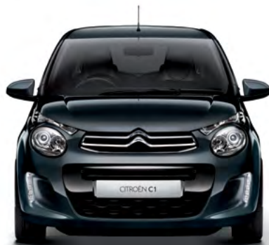
Sivá GALAXITE (M)