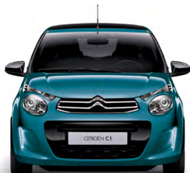
Modrá EMERAUDE (M)

M – metalická farba; N – nemetalická farba