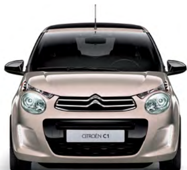
Běžová NUDE (N)