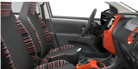
LÁTKA ZEBRA RED