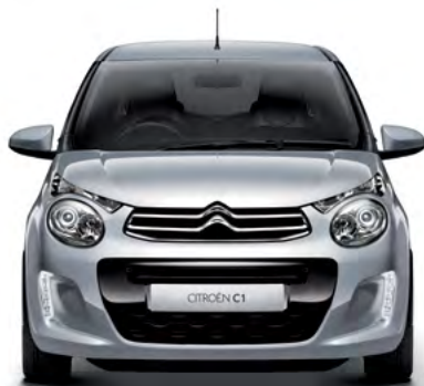
Sivá GALLIUM (M)