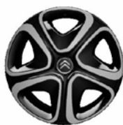
Okrasný kryt 3D 16"