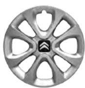
Okrasný kryt ARROW 15"