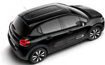
Čierna PERLA NOIR