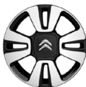
Disk MATRIX 16"