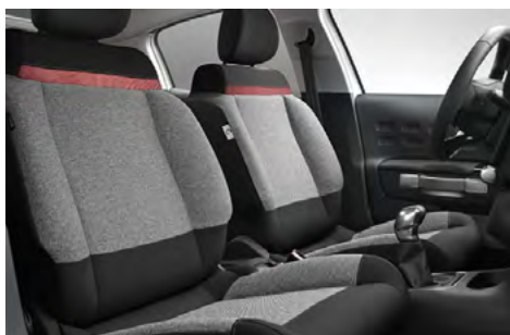
Sedadlá so sivým čalúnením C-SERIES s červeným prvkom