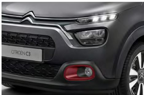
Orámovanie hmlových svetlomietov v červenej farbe REGAL RED.