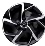
Disk BITON HELLIX 16"