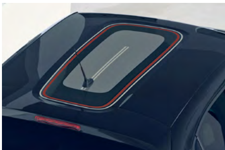
Nálepka na streche v štýle C-SERIES