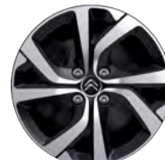
Disk VECTOR 17"