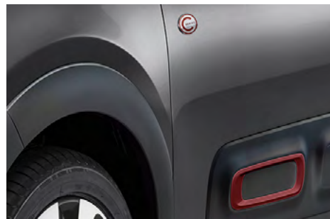
Červený prvok na Airbumpce