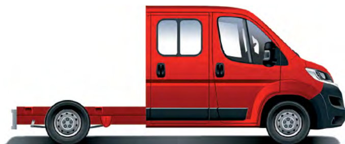
Citroën Jumper Šasi – dvojitá kabína.