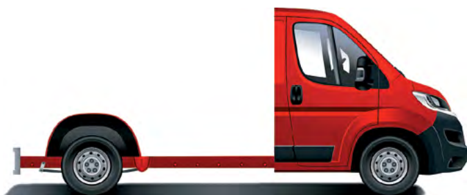
Citroën Jumper Šasi – jednoduchá kabína.