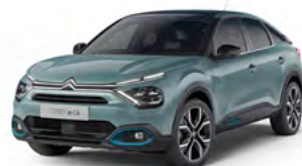
PACK COLOR ANODISED BLUE