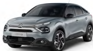
PACK COLOR VAPOR GREY