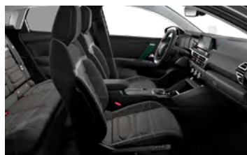
INTERIÉR HYPE BLACK