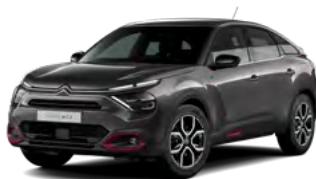
PACK COLOR ANODISED RED