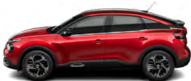
ČERVENÁ ELIXIR (P)

(M) – metalická farba karosérie, (P) – perleťová farba