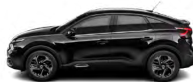
ČIERNA OBSIDIEN (M)