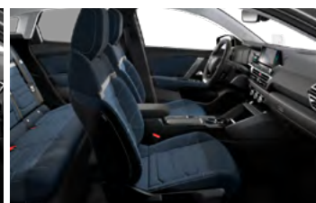
INTERIÉR METROPOLITAN BLUE