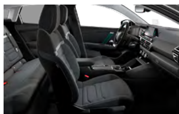
INTERIÉR URBAN GREY (V SÉRII PRE FEEL PACK)