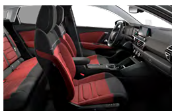
INTERIÉR HYPE RED