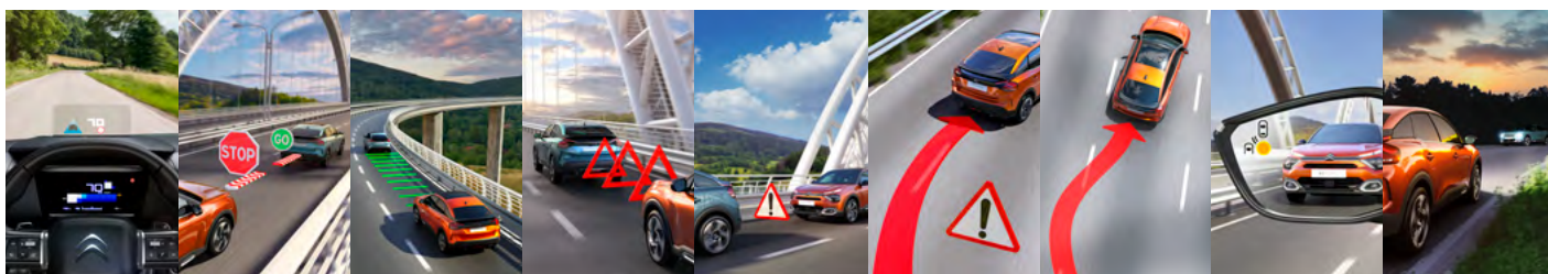
FAREBNÝ HEAD-UP DISPLEJ