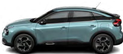
MODRÁ ICELAND (M)