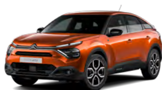
PACK COLOR GLOSSY BLACK