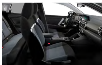
ŠTANDARDNÝ INTERIÉR (PRE LIVE PACK A FEEL)