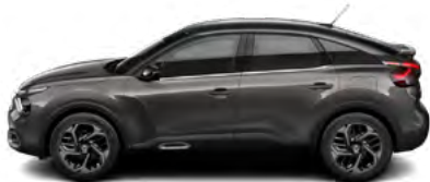
SIVÁ PLATINIUM (M)