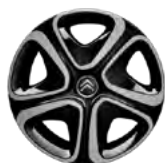
OKRASNÝ KRYT 16" 3D STEEL & STYLE