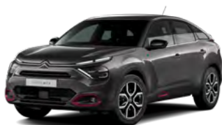
PACK COLOR ANODISED RED