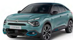
PACK COLOR ANODISED BLUE