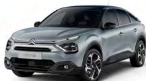
PACK COLOR VAPOR GREY