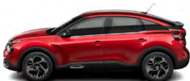
ČERVENÁ ELIXIR (P)

(M) – metalická farba karosérie, (P) – perletová farba