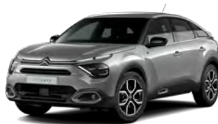
PACK COLOR TEXTURED GREY