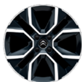
DISK Z LAHKEJ ZLIATINY 18" HANOY