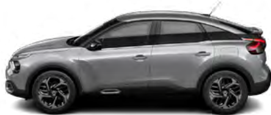
SIVÁ ARTENSE (M)