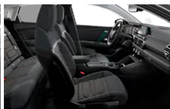
INTERIÉR METROPOLITAN GREY (V SÉRII PRE SHINE)