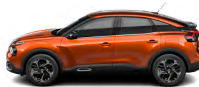
HNEDÁ CAMEL (M)