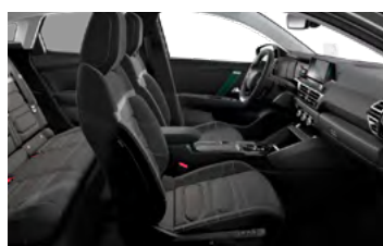
INTERIÉR HYPE BLACK