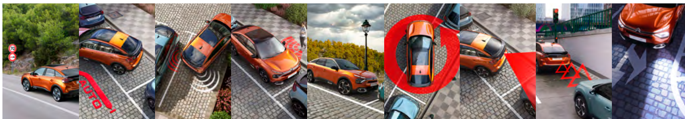
ČÍTANIE DOPRAVNÝCH ZNAČIEK A RÝCHLOSTNÝCH OBMEDZENÍ